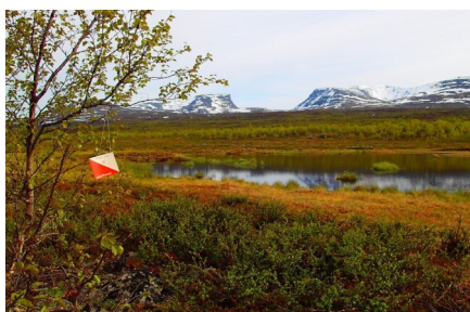
Naturpasset fyller 10år

Har ni funderingar om föreningen eller vill ni engagera er i någon av de aktiviteter vi arrangerar—kontakta då någon i styrelsen.